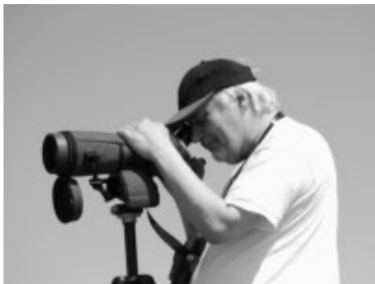
Torbjörn spanar på kejsarörnarna.

Vi hade stora förhoppningar på Bükkbergen när vi åkte upp. Tyvärr blev vi lite besvikna. Området är verkligen storslaget. Ett stort bergsområde beklätt med stora lövskogar av bok, avenbok, sykomorlönn, naverlönn, bergek, turkisk ek med mera. Men området var på grund av all skog ganska svårskådat och det var svårt att hitta bra utkikspunkter. Vi hade hoppats på många hackspettar och fina observationer på örnar. Visst fick vi se en mindre skrikörn och lite hackspettar. Men utdelningen av hackspettar runt vårt hotell var så bra att vi i efterhand skulle ha skådat mer i den södra bergskanten och inte åkt upp i bergen. Vi hade dessutom en magnifik uppvisning av två kejsarörnar precis när vi hade åkt ut ur Bükkområdet strax söder om staden Micolz. Kort sagt verkade kant-