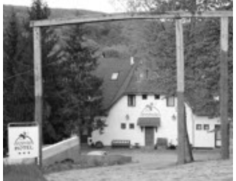
Hotel Nomad.

Vi hade förbokat två boenden: Nomad Hotel Sifokut Noszvaj som ligger i södra kanten av Bükkbergen.