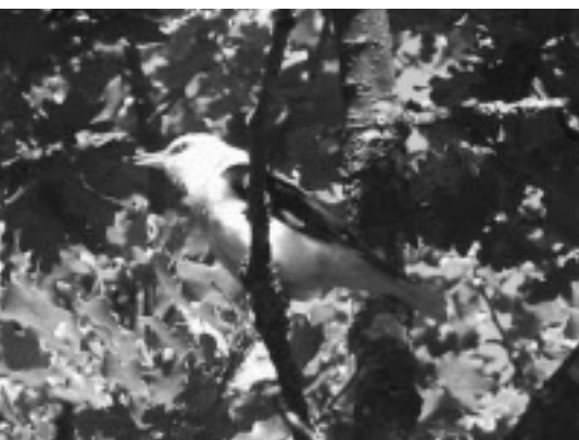
Den adulta hanen av sommargylling som var vid Storstugan.

( http://www.artportalen.se/artportalen/gallery/Image.aspx?rappsyst=0&obsID=12654904&imageID=82722 ).