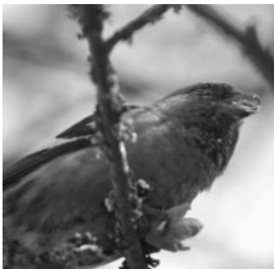
Bändelkorsnäbbshanen i Järna.

Varje höst är speciell. En höst kan det finnas mängder av en viss art och året efter ser man kanske inte en enda av den arten. Vissa fåglar skiljer sig dock så mycket från de vanligt förekommande arterna att de lätt uppmärksammas.. Hösten 2007 började den ovanliga bändelkorsnäbben dyka upp i Sörmland. Den är en rysk fågel som normalt lever ett stationärt, stillsamt och tillbakadraget liv i den folktomma taigan. Bristen på dåliga människoerfarenheter gör att de ofta saknar fåglars normala skygghet. Den fågel som jag fotograferade i centrala Järna den