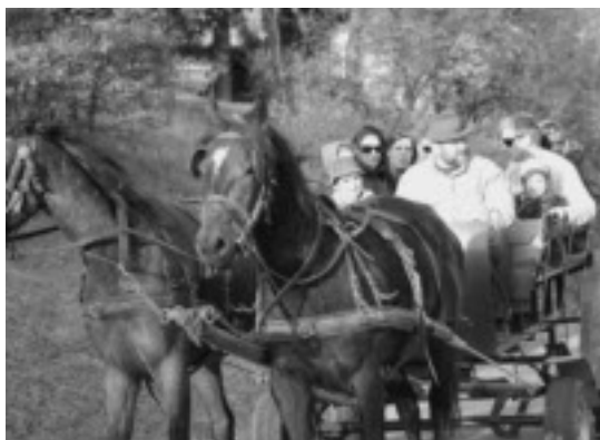
Inte ovanligt att man stöter på ett sådant här ekipage på landsbygden.

Nagyivan Pusta är ett klassiskt ställe för stortrapp. Man kör mot det lilla samhället Nagyivan på en något sämre asfalterad väg. När man