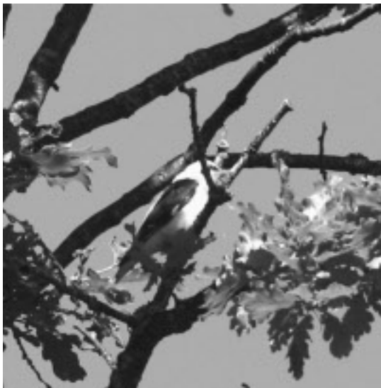
Ibland så satt den riktigt öppet.

Storstugan. Efter ett tag så såg han den också, och då visade det sig att det var en adult (helt utfärgad) hane som sjöng. Givetvis var kameran med och med skicklighet och tur så fick Andreas ett antal bilder av denna sköna juvel. Bilderna som visas här är ju i svartvit och gör inte fågeln riktigt i rättvisa. För att se fågeln i färg så hänvisas till denna länk i svalor;