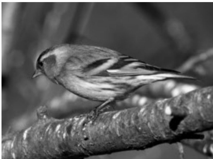
Grönsiska, en art som vi normalt får räkna in vid Horn.