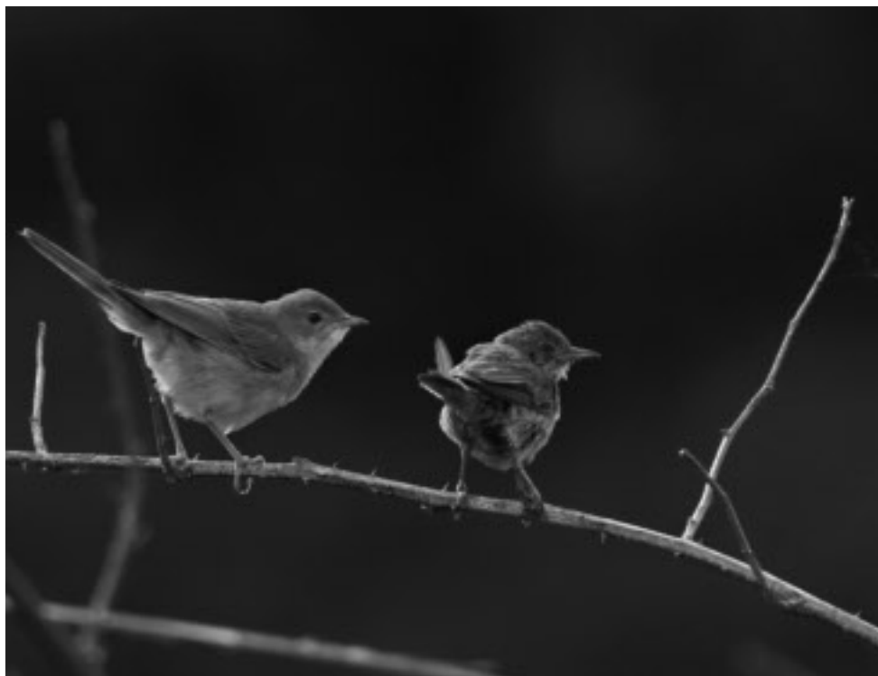
Törnsångare, en art som du mycket väl kan hitta i en buskridå under hösten.