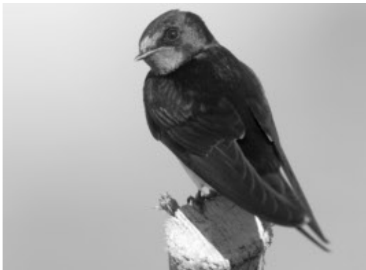
Ladusvala, symbolen för rapportsystemet svalan.