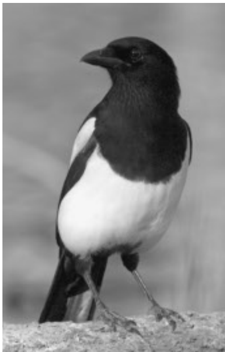
Skata, en art som är nog så viktig under artrallydagen.

Året började med en summering av Tärnans kanske populäraste aktivitet, Artrallyt i januari. Som vanligt var det succé med många, även utsocknes deltagare. Vad som inte syns är dock det arbete bakom kulisserna