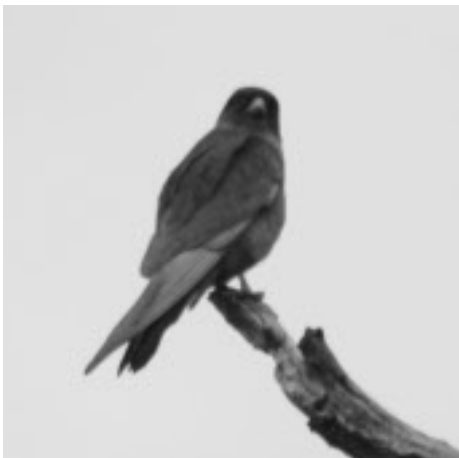
En av de gamla aftonfalkshanarna.

Även lite tornfalkar, brunhökar och härfågel.