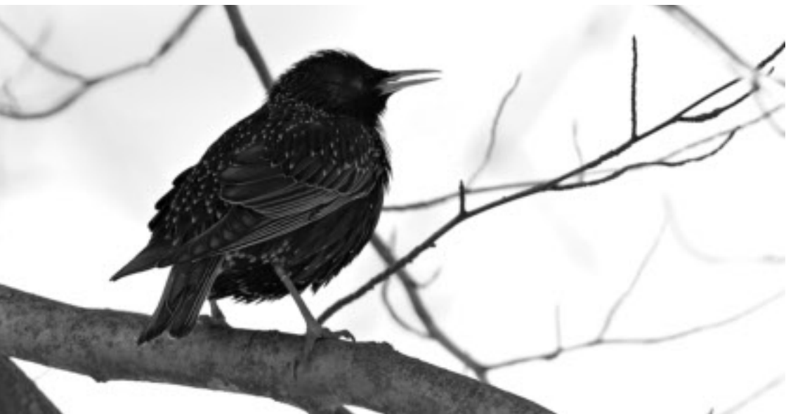
En av stararna vid Ene gård.

jagaren när pilgrimsfalken dyker ned och klipper en kaja. Efter Skåraviken, viltvattnet och Bollbacken tar vi en titt vid Goglunda och Helgesta. På ladugårdsbacken vid Ene gård övervintrar några starar och längre bort vid Kjulsta, ja, ja, nu börjar vi dra iväg långt bort, det var Skåraviken det skulle handla om. Yngaren och Hallbosjön runt får bli en annan gång.