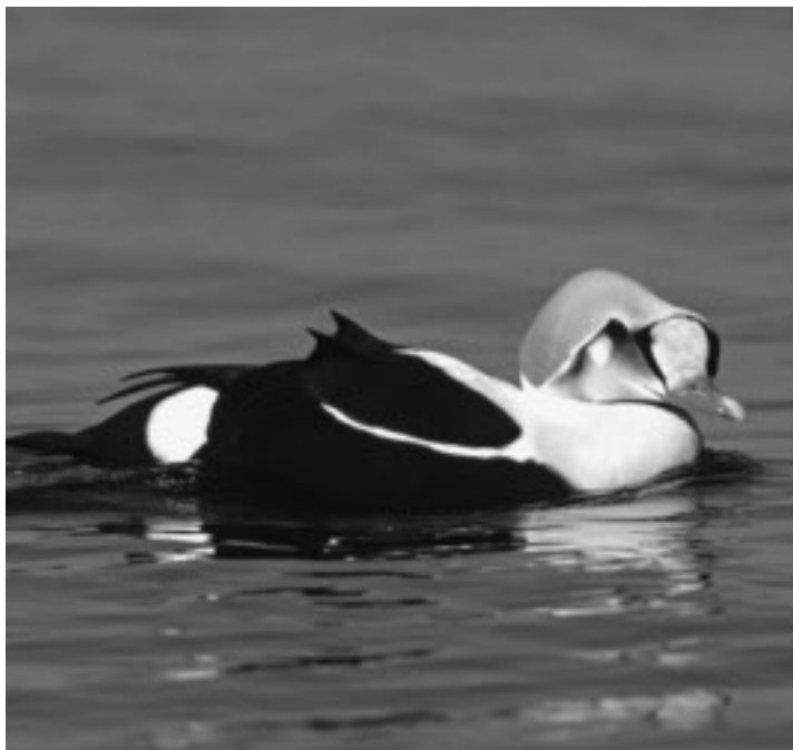
Praktejder, hane. I april i år så fanns det en stationär hane utanför Femörehuvud under några dagar.

Ansvarig Susanne Stilling tel 0155-28 93 01.