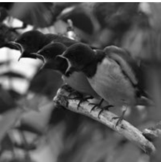
Tre unga ladusvalor som påkallar uppmärksamheten från sina föräldrar. Vi vill ha mat, mat mat mat, mat....

När du lämnar hemmet på morgonen för att gå till arbetet kan det ofta hända att trädgårdarna kryllar av liv och luften är full av de små fåglarnas kontaktlåten. Det är nu i september som de insektsätande fåglarna med siktet inställt på Afrika eller Sydostasien börjar röra på sig. Merparten av ”småfåglarna” är nattflyttare, kanske för att undvika dagrovfåglar, kanske för att navigera efter himlakroppar, trots forskning vet man inte allt om flyttfåglar. Ungefär när du är på väg till arbetet har nattflyttarna landat och är i full färd med att frukostera. Hösten är en tid då fåglarna kan ta det ganska lugnt. På våren