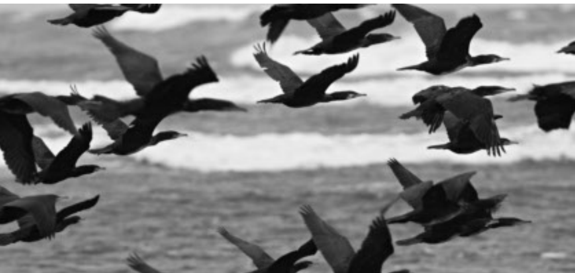
Storskarv, förr "fanns den inte" vid Skåra, numera ses den dagligen.

Vitkindad gås, snatterand, storskarv med flera kunde man bara drömma om, de fanns inte på några andra ställen än i den tidens bästa fågelbok "Europas fåglar" som jag inför-