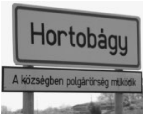
Vägskylt Hortobágy.

Under sista veckoslutet av april 2008 åkte sex personer från Fågel-föreningen Tärnan på en skådarresa till Ungern. Totalt hade vi fyra hela skådardagar och fem nätter vilket vi tyckte var alldeles lagom. Efter lite studier av litteratur och rese-rapporter hade vi valt att ägna oss åt två specifika områden under resan. Bükkbergen som är ett stort lövsjögskogsbeklätt bergsområde i nordöstra Ungern. Dessutom ville vi naturligtvis besöka Hortobágy som ligger i östra Ungern.