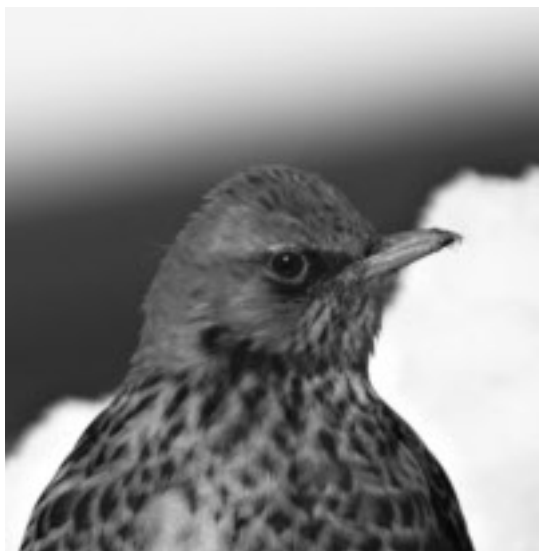
Björktrast, en art som finns på åker och äng vintertid vid Skåra.

Sedan är det dags för området närmast Skåra gård, bästa lokalen i området. Jag parkerar på kullen vid första dungen på vänster sida efter vägskylten. Tittar över viltvattnet och ser att de första salskrakarna kommit, det sitter några blåhakar i vasskanten, på åkern hoppar trastar omkring innan de blir uppskrämda av en klippande stenfalk. Från