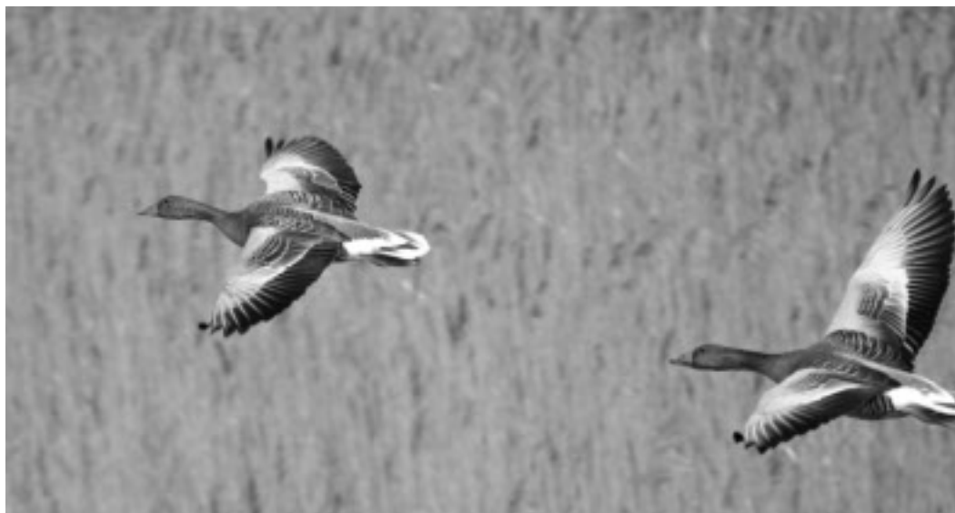
Grågäss som kommer inflygande på våren till Skåraområdet.

Östra delen av Hallbosjön, Skåraviken är en klassisk fågelsjö, grund och omgiven av vass och sankängar. Våren är bästa tiden att besöka området men övriga årstider har