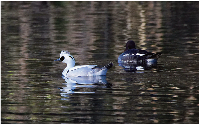
Salskrake, hane, och en vilande knipa.

Få och ge snabb information om spännande fågelobservationer i närområdet. Tärnan erbjuder som komplement till hemsidan tillgång till appen Band Tärnan för smarta telefoner, där du kan få och skicka information till dem som är anslutna. Här kan du direkt rapportera om du ser något ovanligt eller bara få en fråga om samåkning för en skådartur. Här kommer Tärnan att påminna om de aktiviteter som föreningen erbjuder. Du kan få mer information på Tärnans hemsida ( tarnan.eu ).