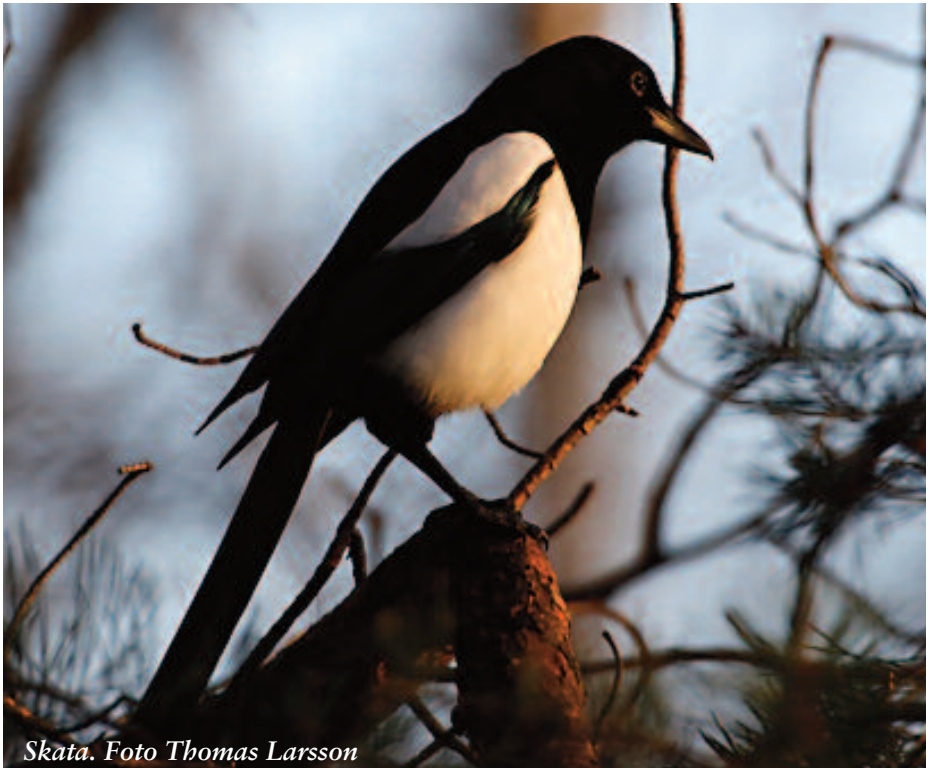
Skata.