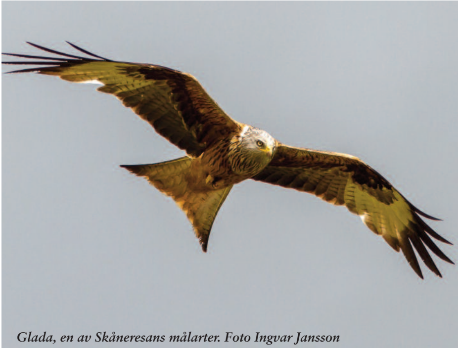
Glada, en av Skåneresans målarter.