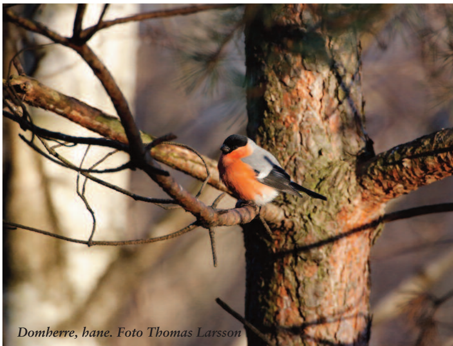
Domherre, hane.

app för smarttelefoner. Få snabb information och ge snabb information till dina fågelskådarekamrater. Tärnan erbjuder som komplement till hemsidan och sörmlandsmailet tillgång till en app till mobiltelefonen där du kan få och skicka information till de som är anslutna. Här kan du direkt rapportera om du ser något ovanligt eller bara få en fråga om samåkning för en skådartur. Här kommer Tärnan att påminna om de aktiviteter som föreningen erbjuder. Mer information läser du på Tärnans hemsida tarnan.eu