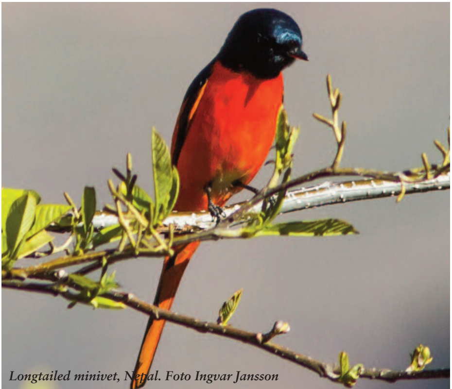
Longtailed minivet, Nepal.

I våras var tre medlemmar från Tärnan i Nepal och bl.a. skådade fågel. Denna kväll bjuder de på en billigare variant på resa då de