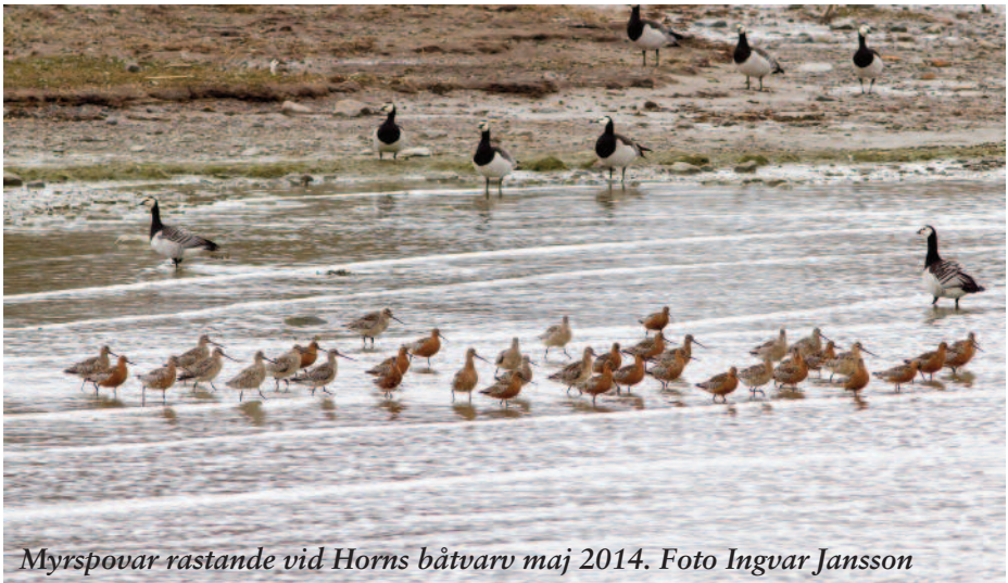
Myrspovar rastande vid Horns båtvarv maj 2014.

Ansvariga Ingvar Jansson 070-570 70 25 och Stig Larsson.