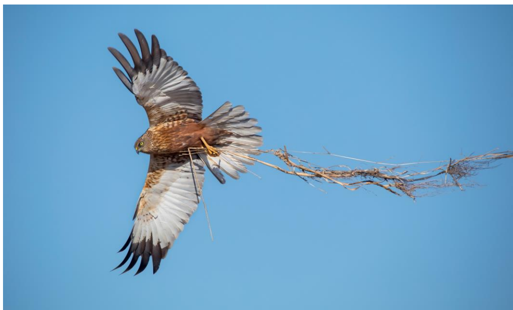
Brun kärrhök med bomaterial.