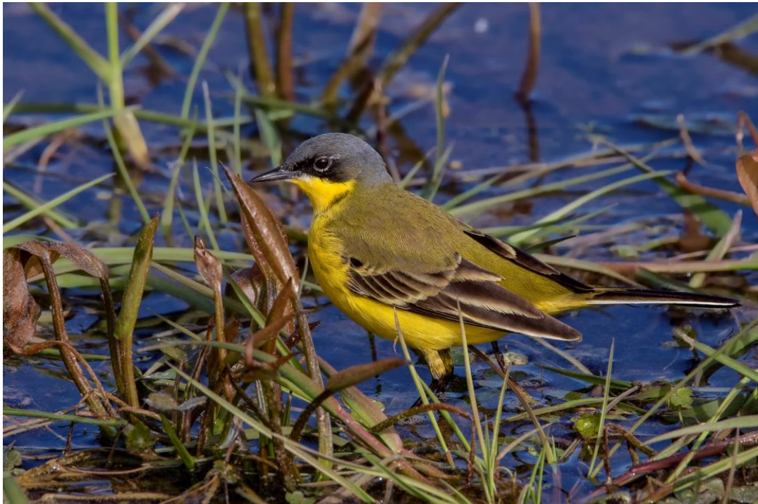
Gulärla av rasen thunbergi.

I övrigt fanns det gott om arter som rörde sig i området, antingen som rastare eller förbiflygare. Totalt noterades 40 olika arter (häckarna ej inräknade).