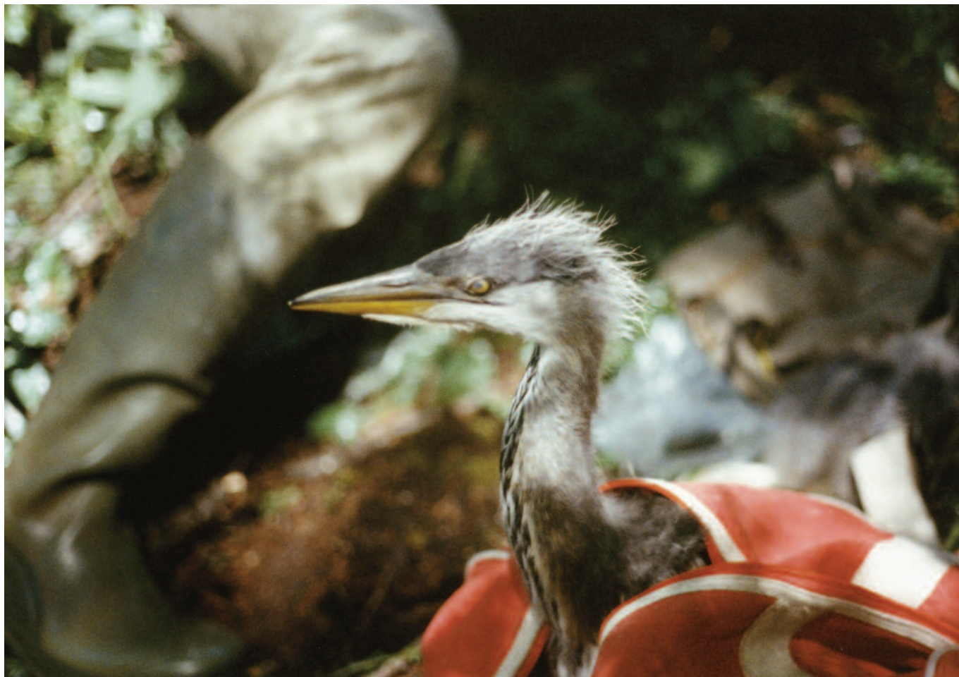
Gråhäger, en ungfågel som fick resa i en väska ner till marken för ringmärkning.