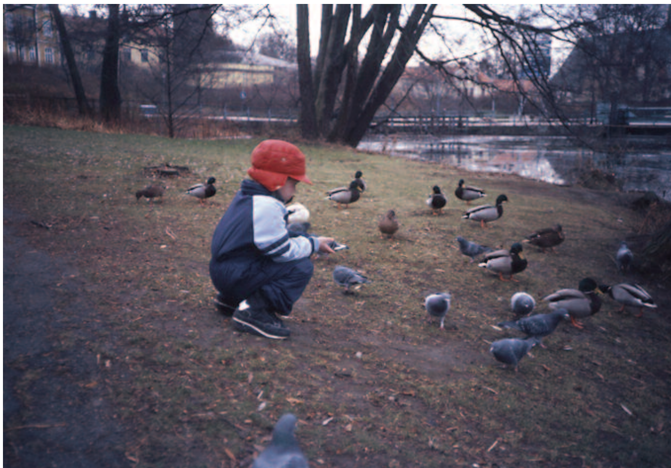
Vi har många börjat skåda i unga år, inte alla så här ungt.