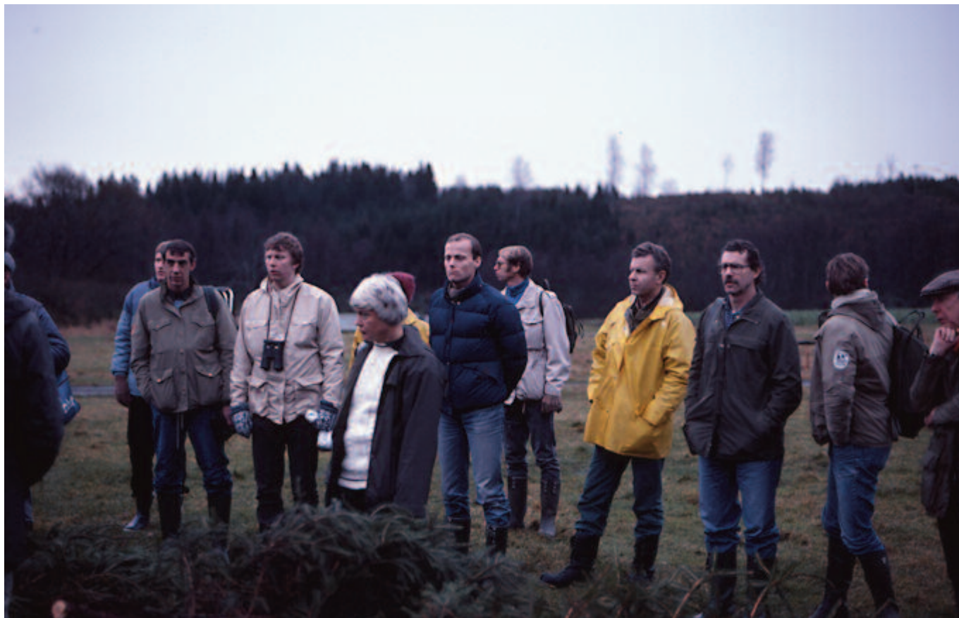
Från någon av Tärnans exkursioner. Är det någon som kan tala om varifrån det är?