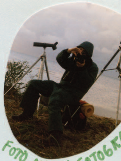
FOTO AV EN FOTOGRAF