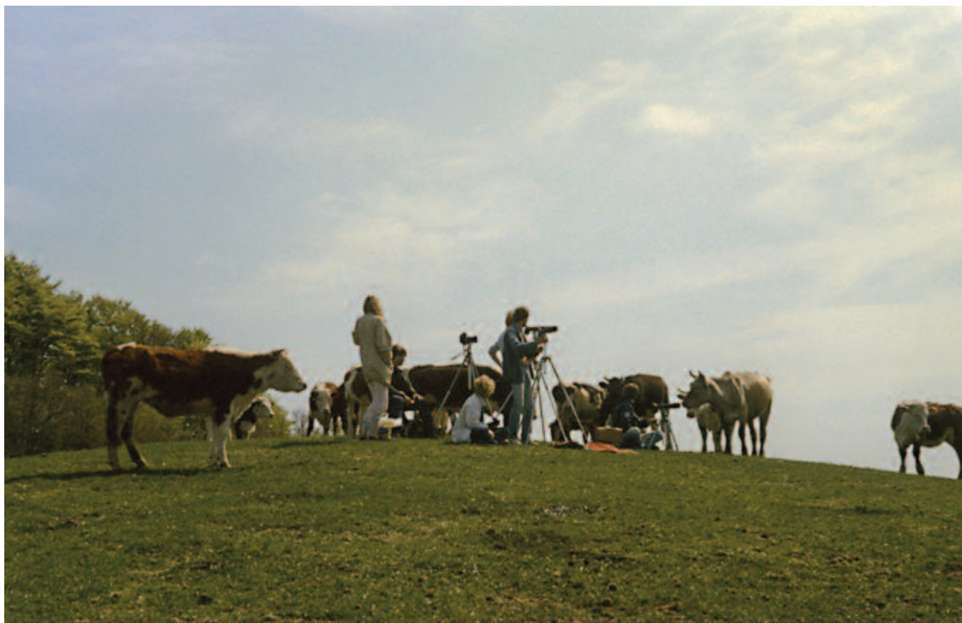
Skådning tillsammans med kor i Fyledalen.