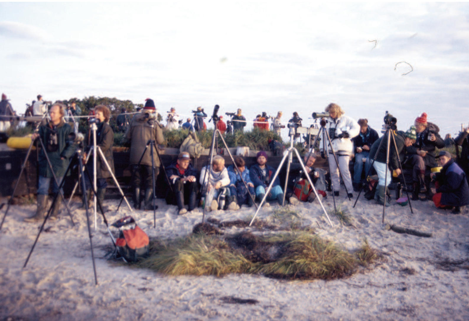
Skådning varvas med matraster vid Nabben, Falsterbo.