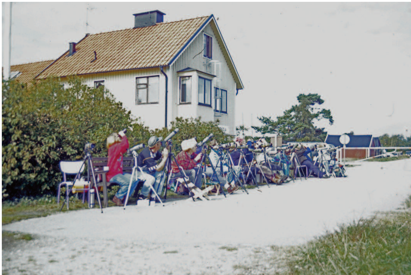
Skådning vid lotsvillan vid Falsterbokanalen.