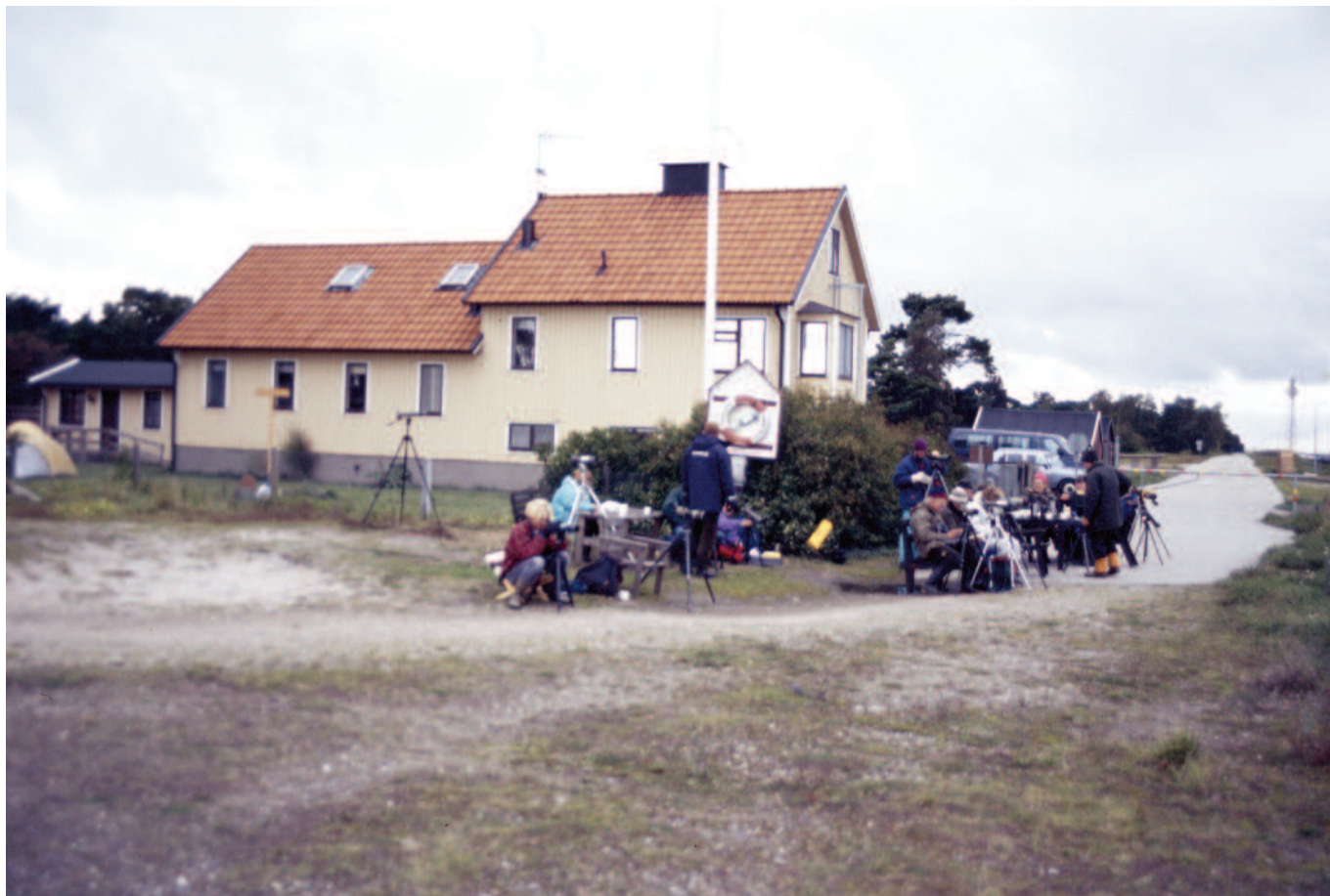
Lotsvillan vid Falsterbo kanalen, här bodde Tärnan ofta vid sina resor till Falsterbo.