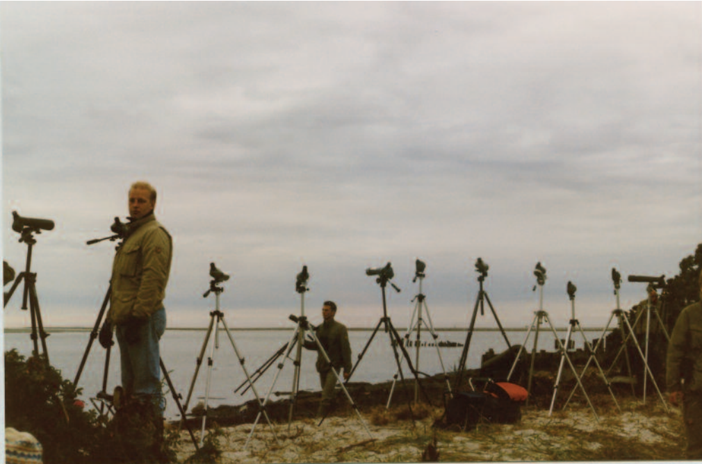
TUBER O ÅTER TUBER