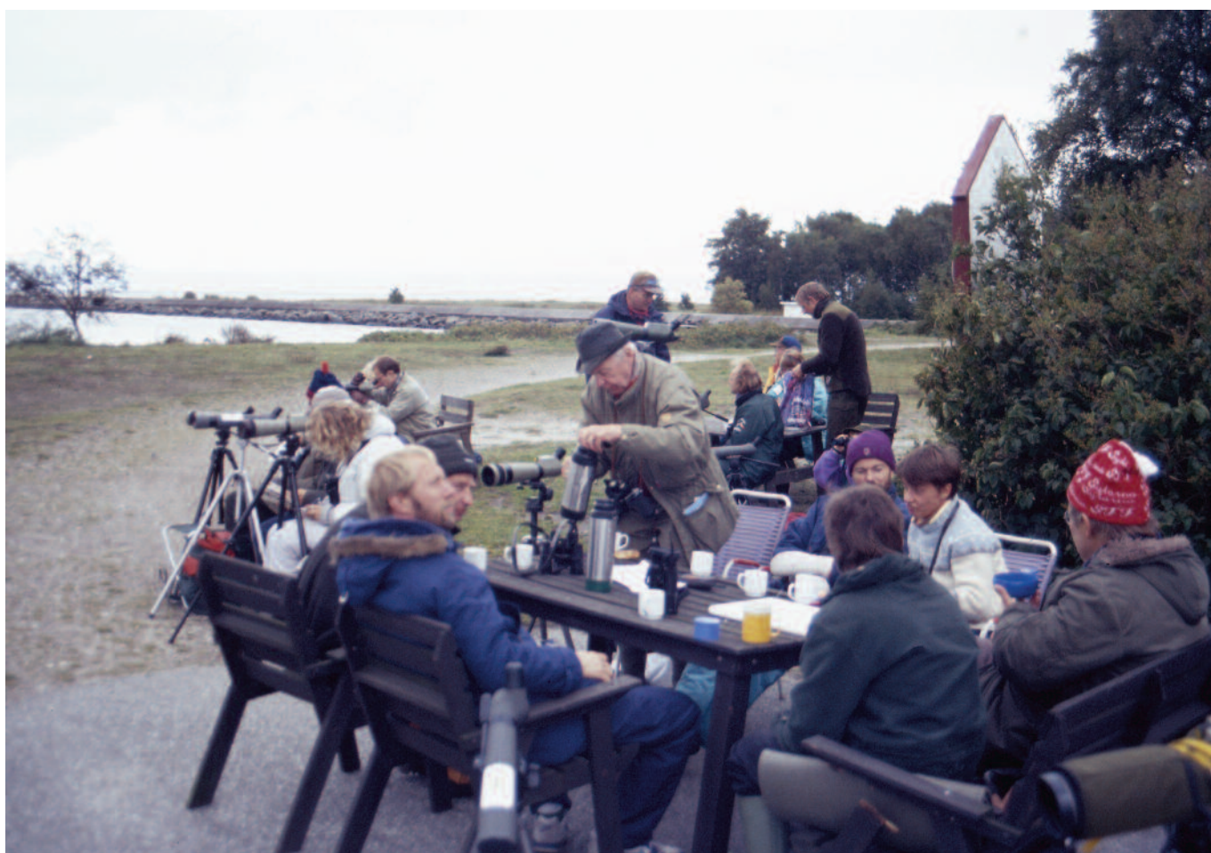
Kombinerad skådning och matrast vid Falsterbokanalen.