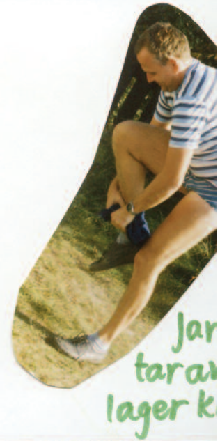
Jan tarar lager k