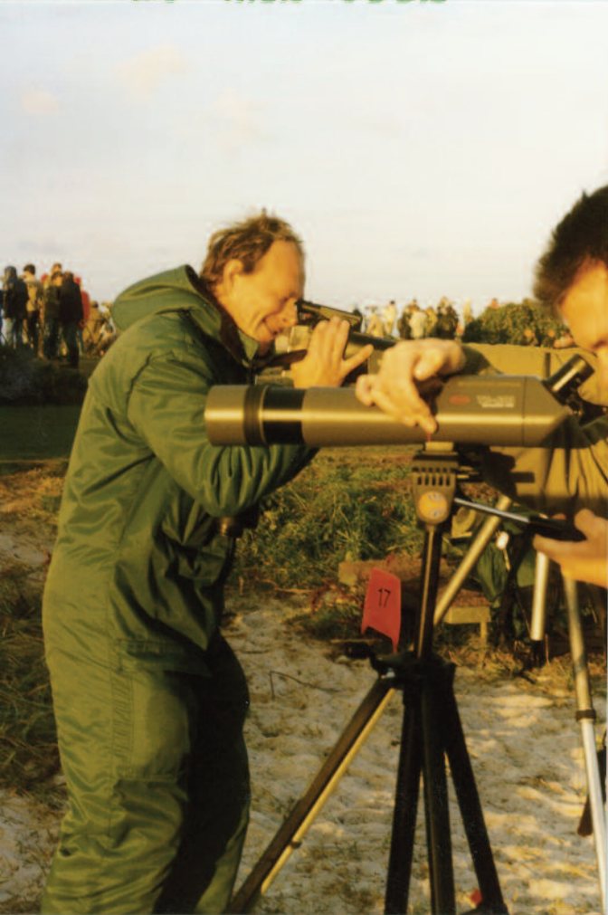
Mycket att titta på åt alla håll