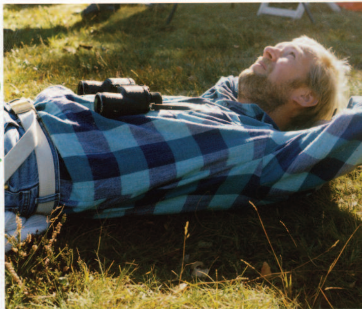
Inte dumt att ligga på rygg o s in 1000-tals vråkar.