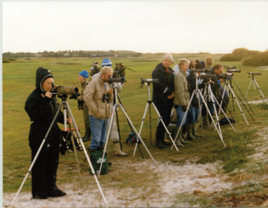
Med Tärnan till Falsterbo