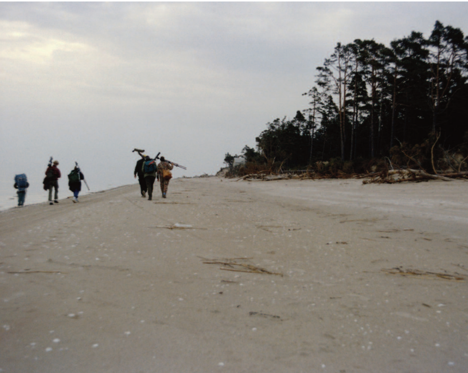
Vandring på milslånga sandstränder.