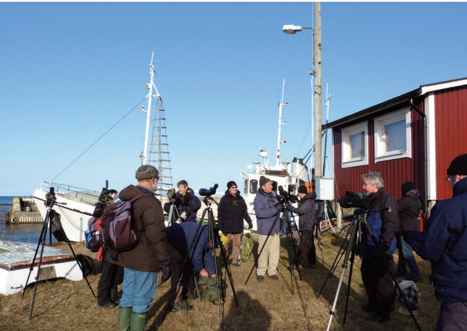
En resa till Hävringe 2011 i en studiecirkel hos Tärnan. Vi åkte ut en tidig vårdag med båten Langesund. Här är samling i hamnen på Hävringe innan vi började vår skådning.