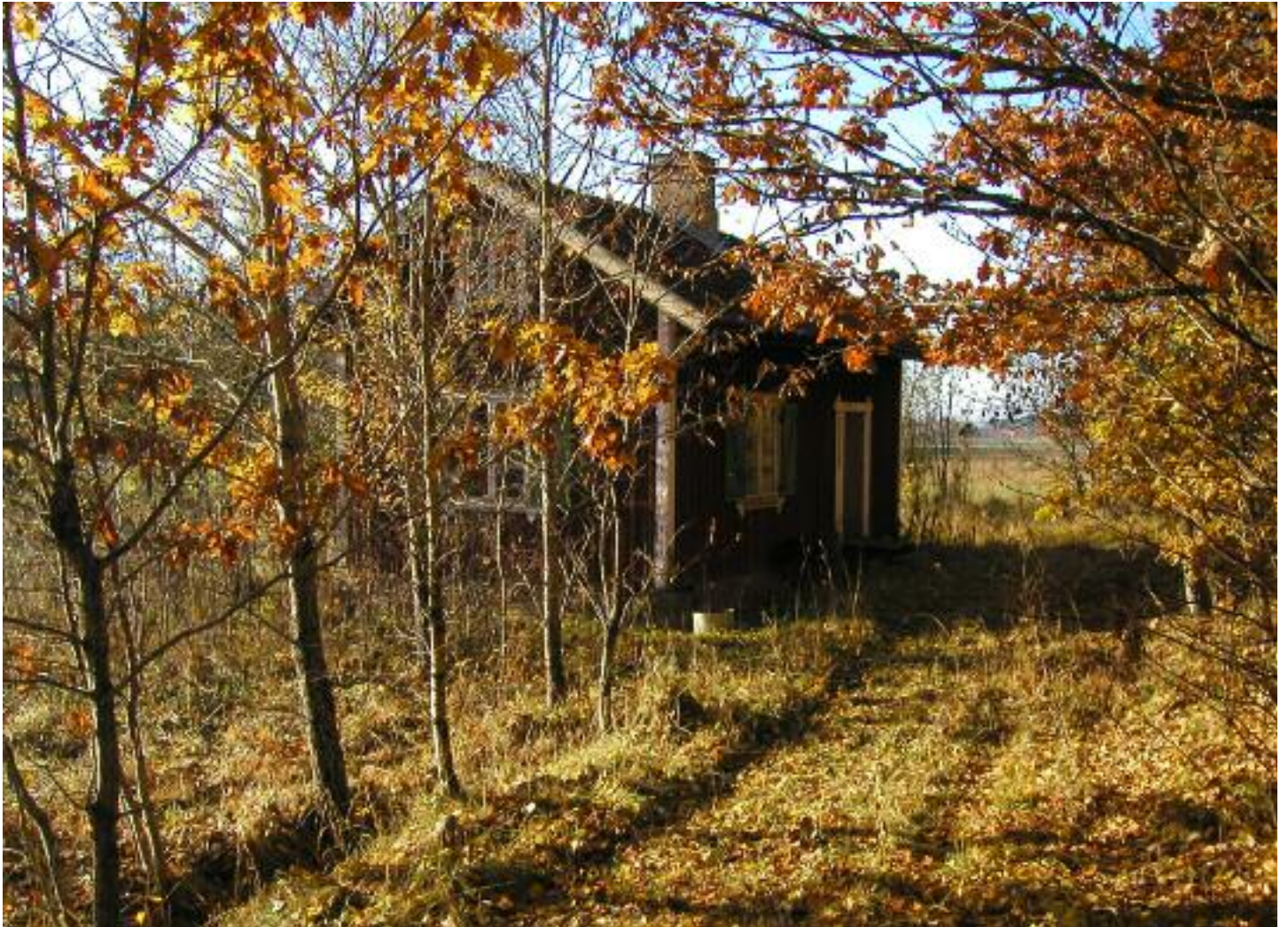
En höstdag 2011 ser det ut så här när man anländer till torpet.