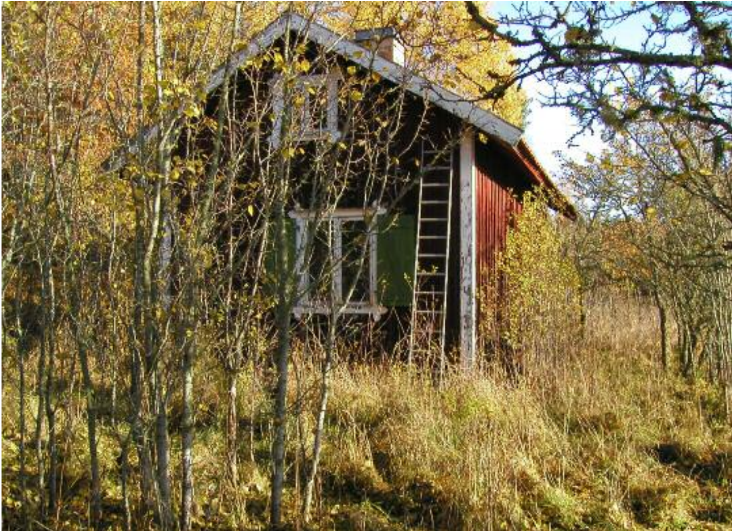
Omgivningen kring torpet växer igen och torpet tar mer och mer stryk 2011.