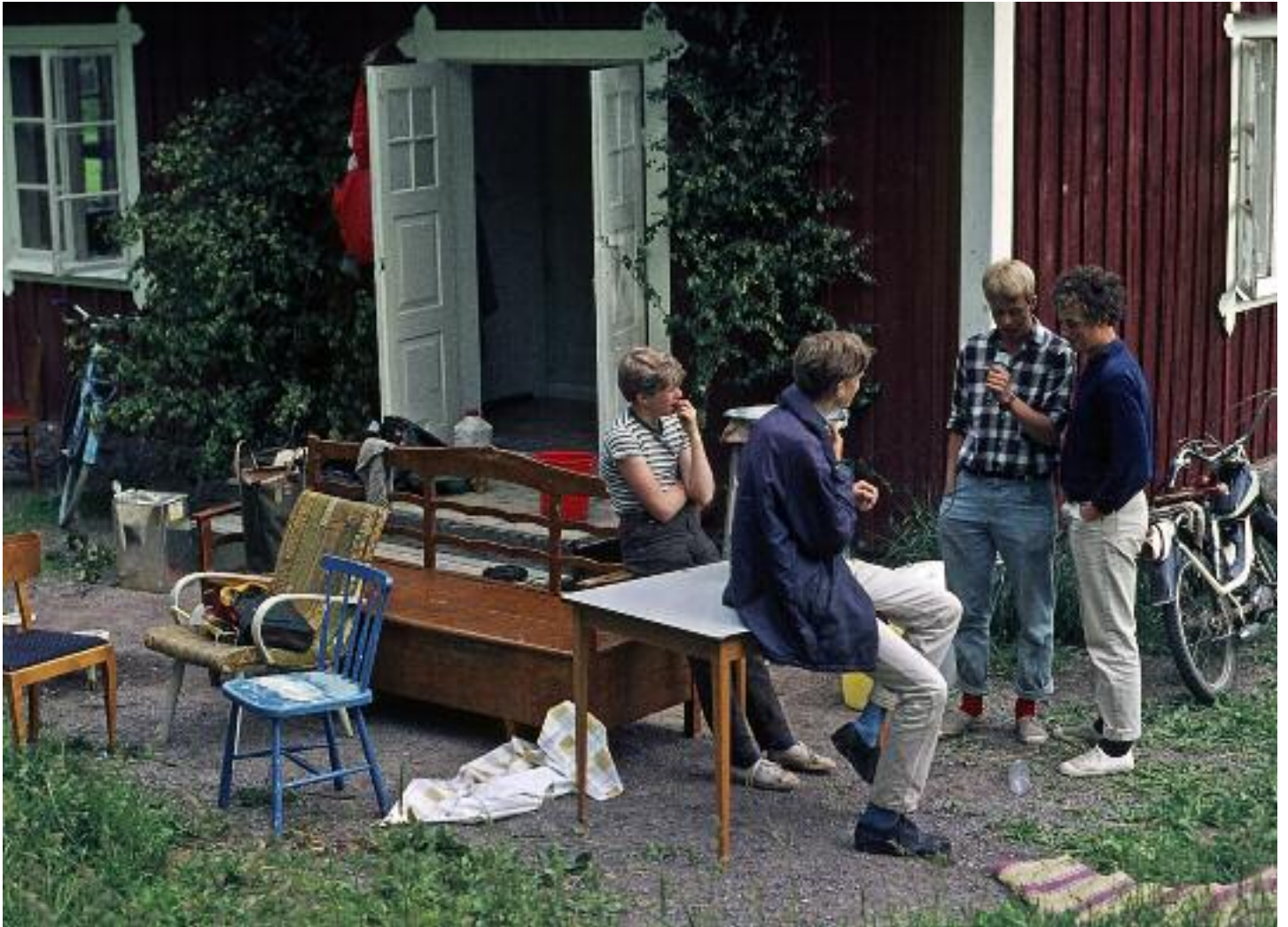
Storstädning av torpet. Torpet sköttes för att man skulle bo där, vilket man också gjorde nästan varje helg.